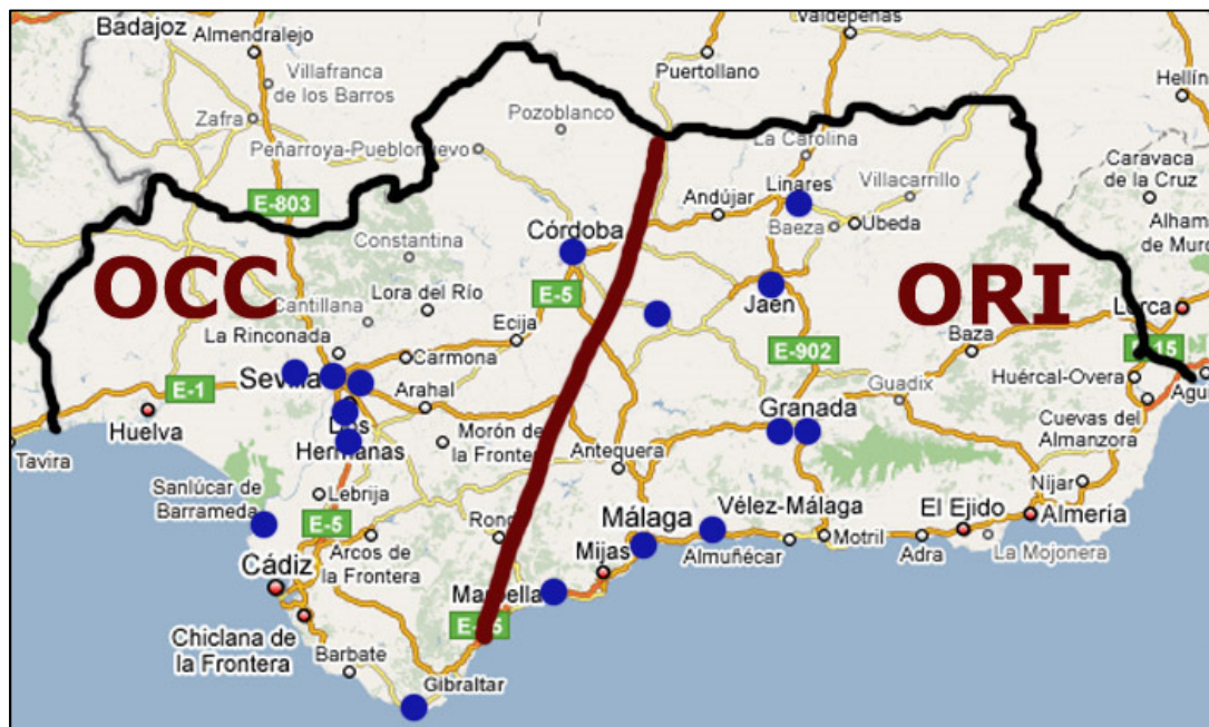
MAPA DE EQUIPOS DE DIVISIÓN DE HONOR