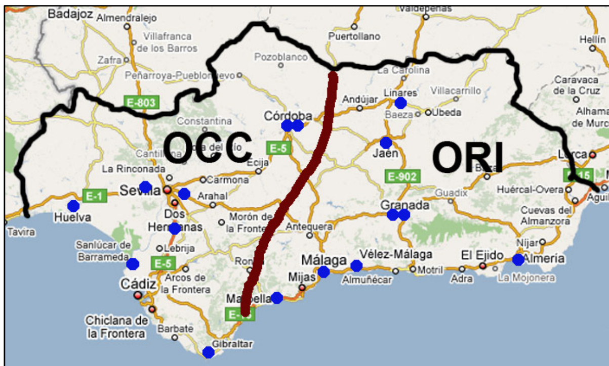
MAPA DE EQUIPOS DE DIVISIÓN DE HONOR